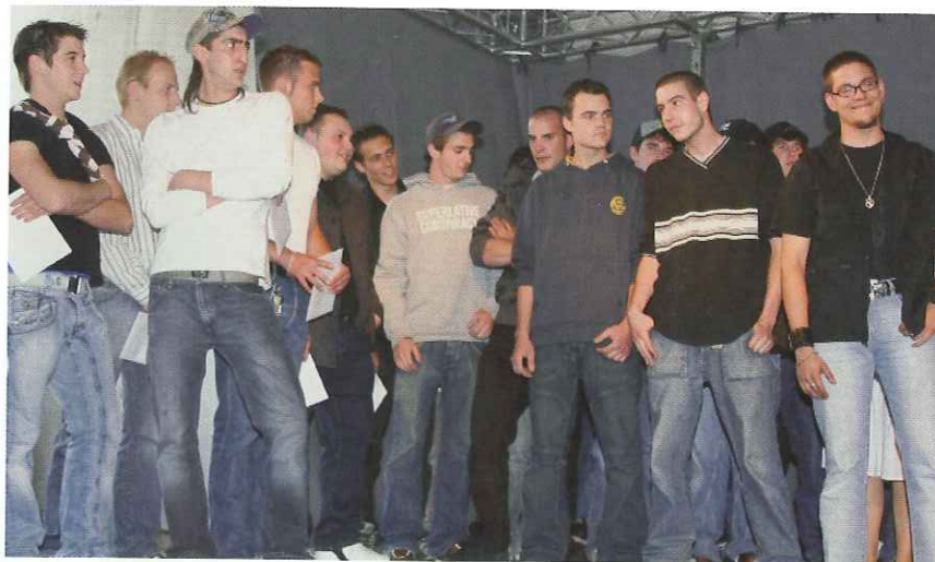
Rätselraten: Jeansreklame oder Jungmetallbauer?